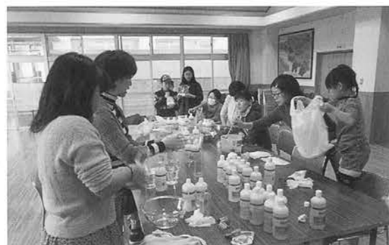
ローションづくり