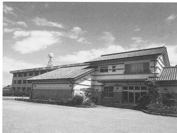
稲生ふれあい館（小学校と隣接）

2009年2月に高齢者のグループによって発足していた「稲生びわ研究会」の活動を地域