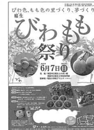
新年度のびわもも祭り 案内

レットづくり、びわ種のローション・せっけんの試作開発、そしてびわ種のオリジナルブランドマークづくりです。