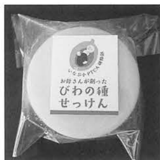
専用ブランドマークの付いたせっけんの見本