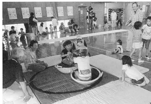
びわ太郎VSもも太郎 中華鍋相撲

本事業において、新たな公民館への参画者は、稲生小学校PTCA研修部の母親たちでした。その方たちの興味のある内容を用意し、彼女らに任せる「場づくり」ができたことが母親の高い満足度につながったと考えます。任せたものは、「びわの里・稲生」のリーフ